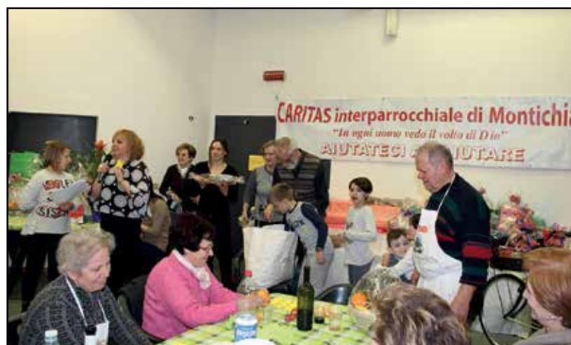
Il momento importante della lotteria.

Il ricavato dell'iniziativa verrà utilizzato per i vari scopi dove la Caritas è presente in prima linea per soddisfare al meglio le numerose necessità di un numero insospettato di famiglie bisognose.