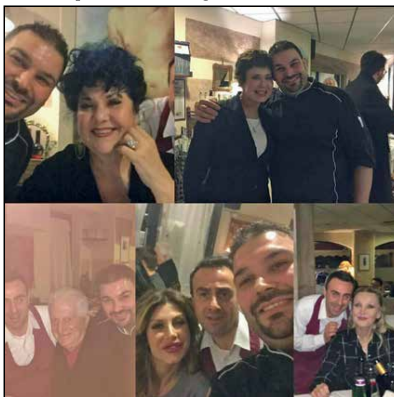
Un collage di selfy con i graditi ospiti.

Un ricordo fotografico delle diverse personalità che