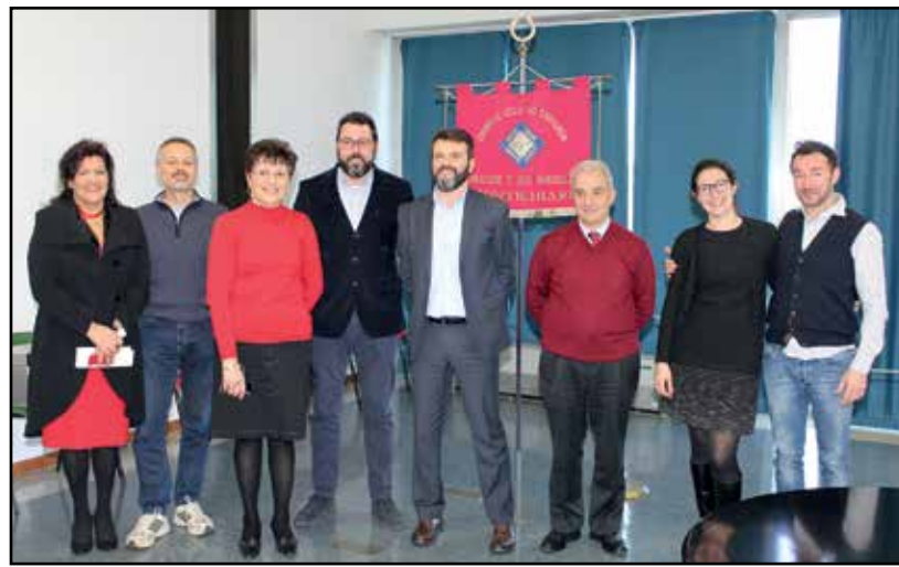
Alcuni membri del consiglio direttivo riconfermati anche per il prossimo mandato.

Nel 2017 ci saranno 21 date: 2 di sabato, 8 di domenica e 11 di venerdì. Nel 2016 si è conclusa la ristrutturazione della nostra sede, nell'ex portineria dell'ospedale, un'opera impegnativa e di difficile realizzazione, ma finalmente operativa.. Si sono svolte come ogni anno le molteplici at-