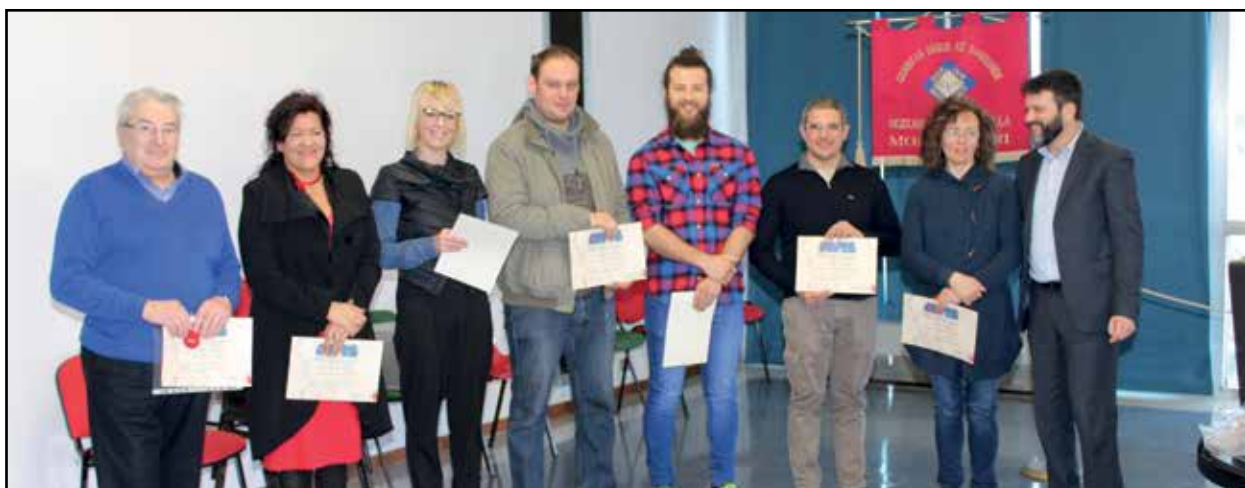
Alcuni dei premiati presenti all'assemblea.