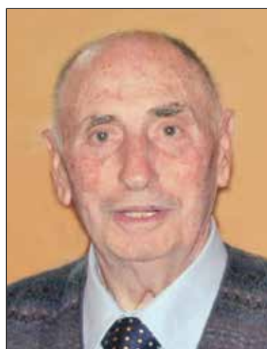
Natale Este 2° anniversario